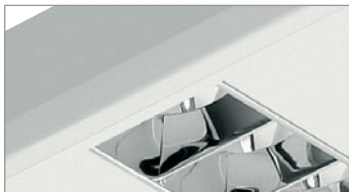
NX-T5/Micro (bajo consulta)