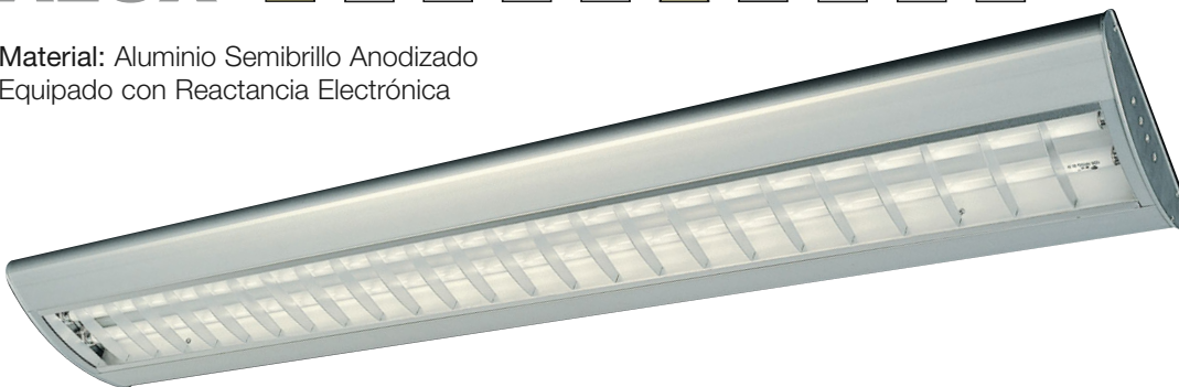
ALUX 2x54 W.

Material: Aluminio Semibrillo Anodizado Equipado con Reactancia Electrónica