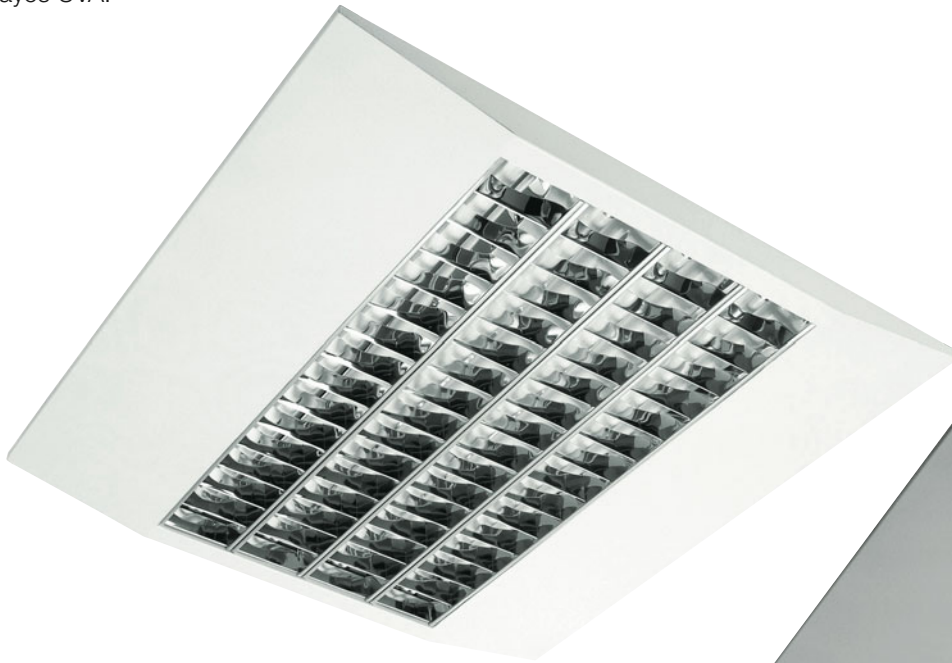
NT-5 4x14 W.